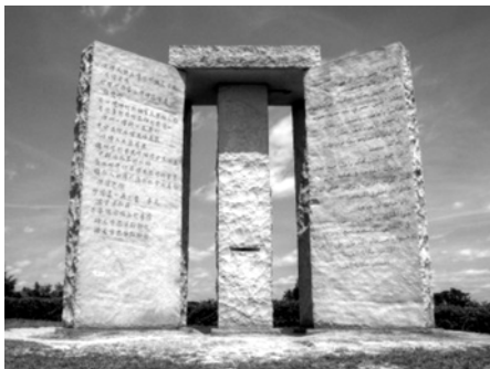
Abb. 1: Die Georgia Guidestones bilden ein großes Monument, das sich in Elbert County im US-Bundesstaat Georgia befindet.

lionen Toten angesichts der Vernichtungskraft heutiger Waffensysteme eigentlich unführbar geworden sind – man will nicht den ganzen Planeten riskieren –, sei man dazu übergegangen, tödliche Krankheitserreger, Viren, radiologische und biologische Waffen auf die Bevölkerung loszulassen. Die Menschen hätten keinen blässen Schimmer, was in diesem Forschungsbereich alles auf der Welt